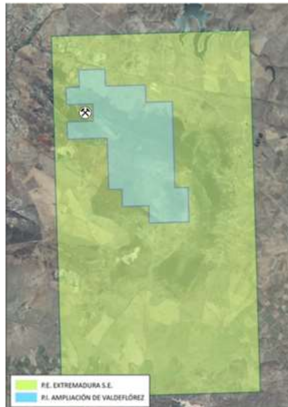
Figure 1: Zona del proyecto

Toda futura presentación de una notificación de Solicitud de Concesión de Explotación ("ECA") comprenderá zonas incluidas en PESE y PIAV.