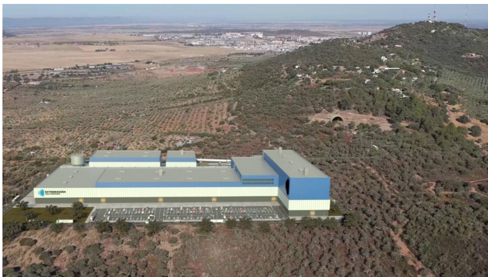
Figure 3: Site Option B