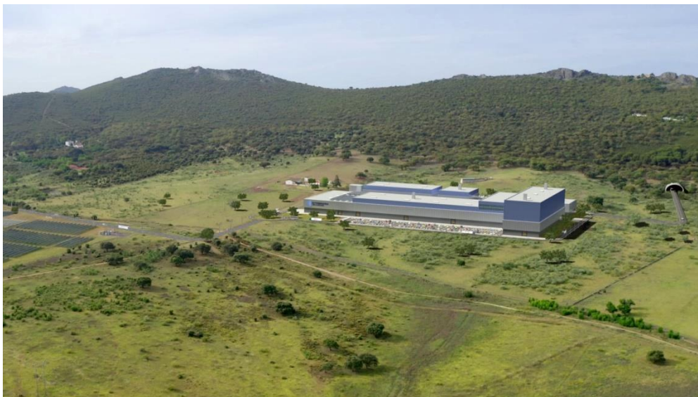
Figura 4: Zona C