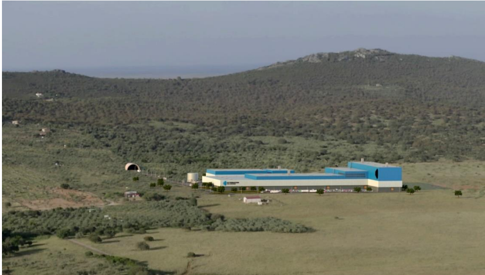
Figura 2: Zona A