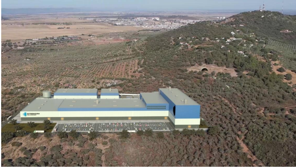
Figura 3: Zona B