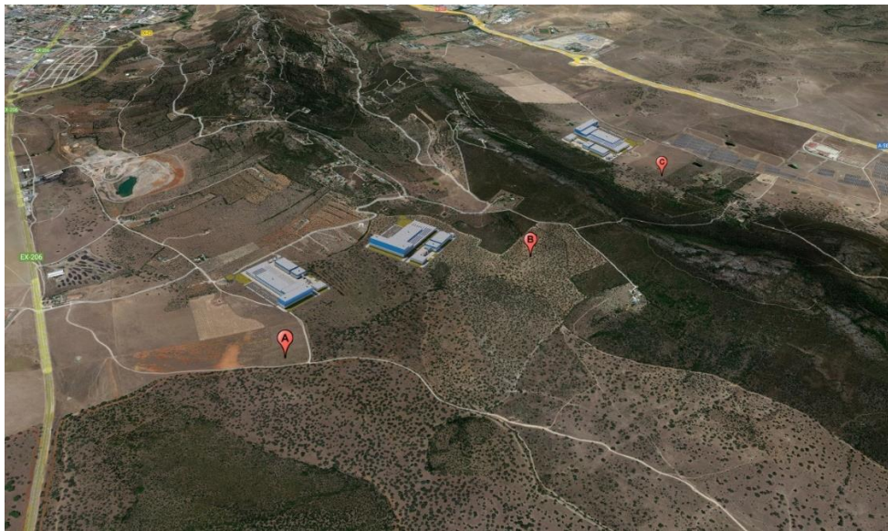
Figure 1: Integrated Industrial Facility Options Presented in the Initial Document